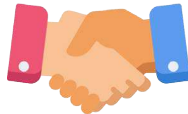
СПЕЦИАЛЬНО СОЗДАННЫЕ ВАКАНСИИ